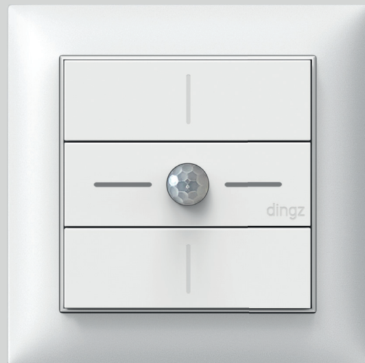
dingz plus Taster mit Bewegungsmelder

(OK, eventuell mehrere davon. Und es gibt zwei Modelle)